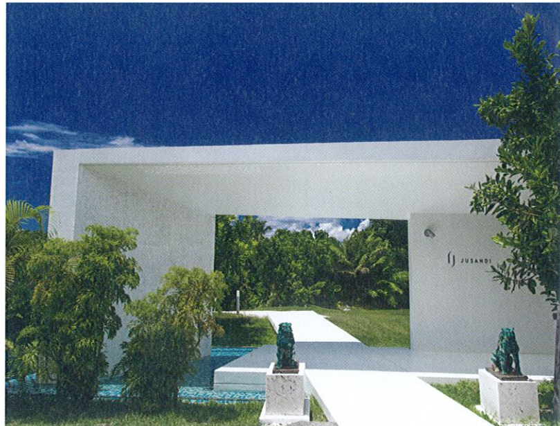
Ci-dessus, l'hôtel Jusandi, sur l'île d'Ishigaki, combine architecture minimaliste et luxe exclusif.

+81 98-921- 6111. www.terrace.co.jp/en/uza